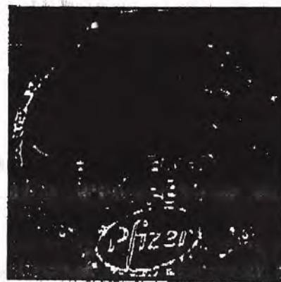
Figura nr. 2: Sigiliu falsificat